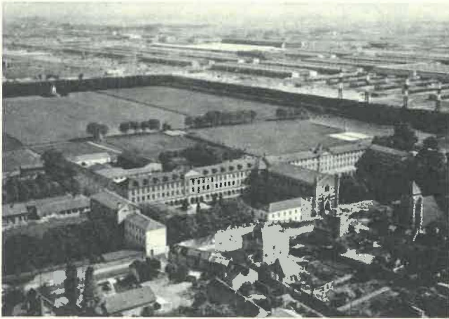
Chevilly, vue générale.