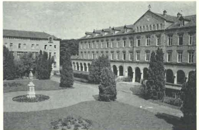
Chevilly, les locaux du Chapitre.