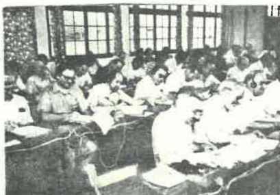
Antes da eleição

Já vai longe o tempo em que, segundo os termos das nossas Regras latinas, os conselheiros gerais eram escolhidos ex antiquioribus sodalibus (entre os confrades mais idosos - nº 10). O Conselho Geral de 1938, eleito por 12 anos, tinha 59 anos como média de idade no momento da eleição; o de 1980, eleito por seis anos, tem 46.