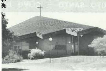
L'église de Pine Rivers.