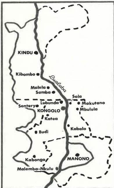
La ligne continue indique le District spiritain d'origine. Les lignes en pointillé marquent les limites des diocèses actuels.

En mai 1909 les PP. Villetaz et Brangers et le F. Euloge prennent le chemin de Kongolo, d'abord par rail, puis en bateau, enfin une longue étape à pied. Ils arrivent le 7 juin et s'installent sur la colline de Misalwe. Une semaine plus tard, le prince Albert le futur Roi visite la région, et à son départ le camp qu'il a occupé est donné aux missionnaires. Peu à peu, la gare et le port fluvial se terminent; un camp de travailleurs, les factoreries, l'Administration - assez étoffée - et le Camp militaire s'installent. Les Pères, éloignés de 5 kms du centre, obtiennent une concession près de la gare et organisent méthodiquement l'évangélisation, dans le centre et dans les villages de brousse. En 1913, on inscrit 413 baptêmes au registre ad hoc.