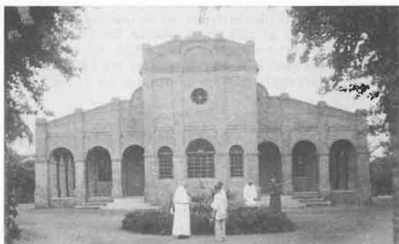
L'ancien évêché à Kongolo - maintenant la procure du diocèse.