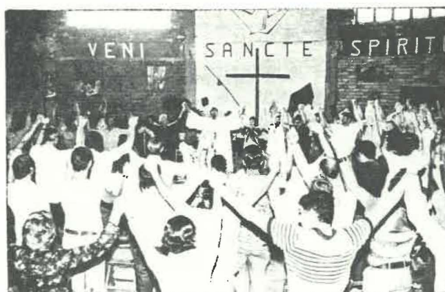
O Congresso Internacional de Jovens Espiritanos em Aranda, Agosto de 1977