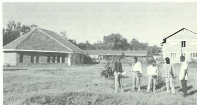
La maison de théologie à Nairobi, avec la chapelle à gauche.