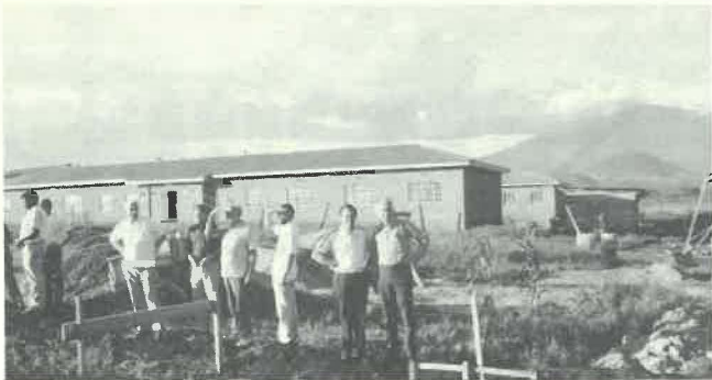
La maison de philosophie à Njiru (en arrière plan le Mont Meru).