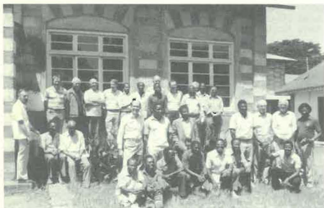
Le Chapitre à Usa River.