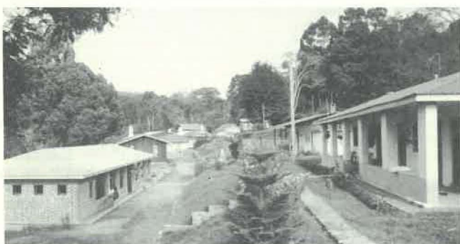
Le noviciat à Magamba.