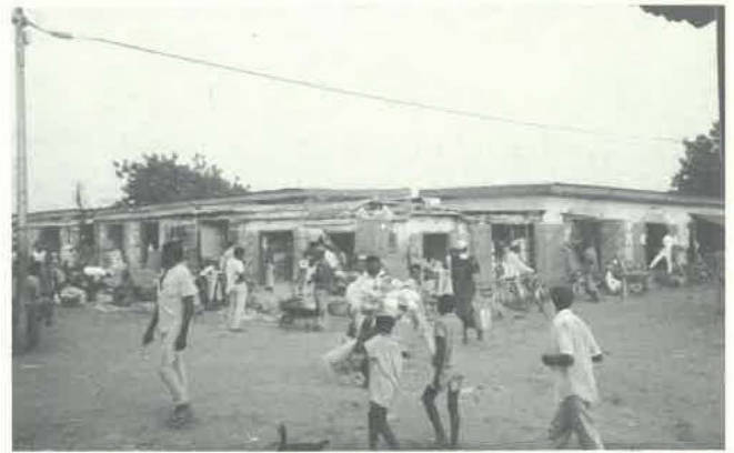
Le marché à Wukari.