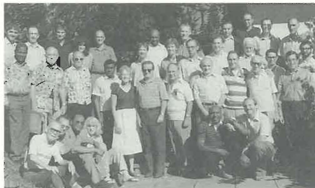
Le Chapitre du District, 1987.