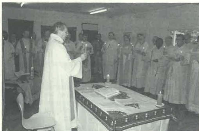
La messe du dimanche de Pentecôte.