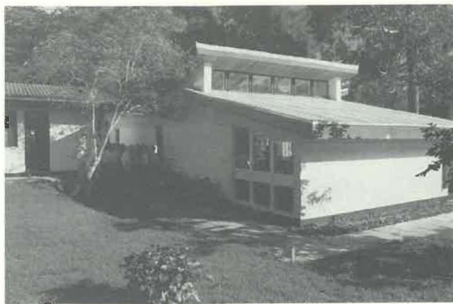
La salle de réunion au Danish Centre.

Le dernier soir, après le souper, le District offrit à ses hôtes un spectacle animé par un groupe de dan-