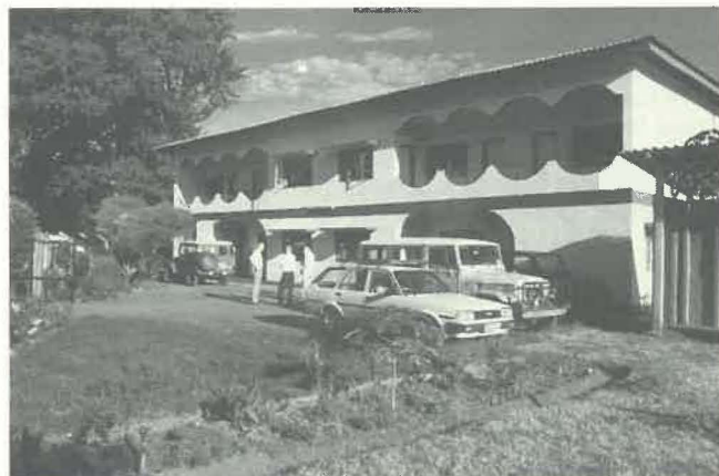
La Maison du District, Arusha.

Ce Centre, situé tout près du Petit Séminaire d'Usa River, a été créé par le Gouvernement danois en vue de former des volontaires laïcs désireux de travailler en Afrique; mais il est également utilisé par divers groupes comme lieu de conférence. Le Centre est composé de plusieurs bungalows: les plus grands servent de salles de réunion, les plus petits, pour le logement des personnes. Les chambres étaient