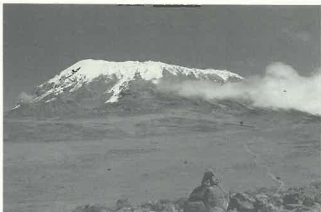
Le but est proche.

Le P. Doyle présenta le problème des Associés laïcs , puis il y eut une mise à jour de leur situation dans les six circonscriptions qui font une expérience en ce domaine: le Canada, le Trans-Canada, l'Allemagne, l'Espagne, les Etats-Unis/Est et le Kilimanjaro. Le sentiment général est qu'il faut continuer à collaborer étroitement avec le laïcat, mais les modalités exactes