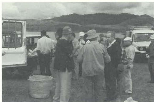
L'excursion dans le Parc National d'Arusha.