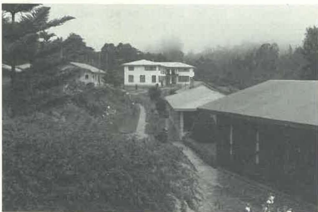
Le noviciat de la Province de l'Afrique de l'Est à Magamba — au fond le nouveau bâtiment Poulart des Places.