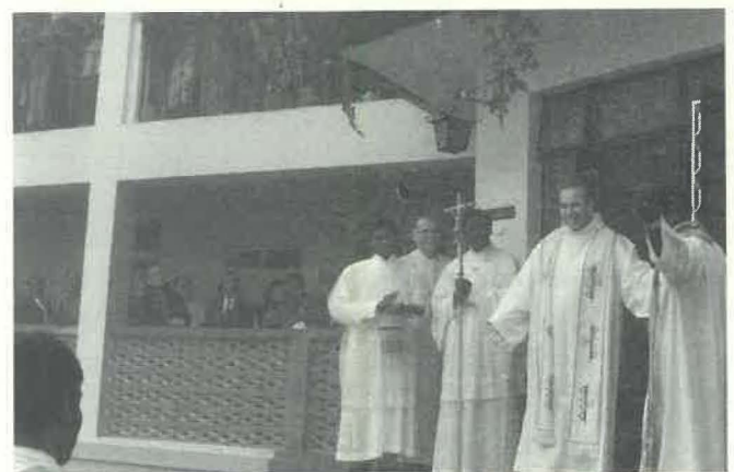
Le Supérieur général inaugure le nouveau bâtiment.