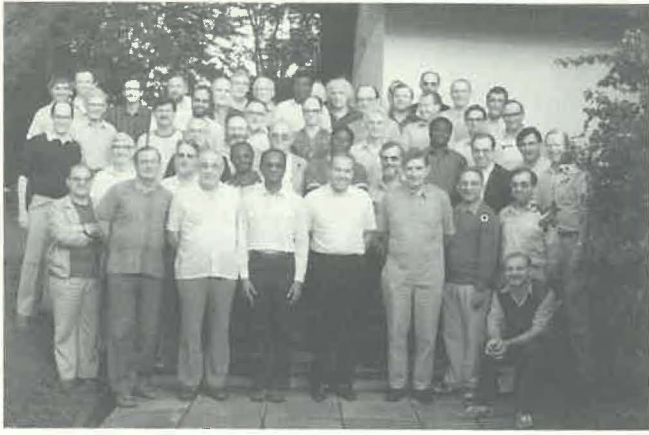
Les délégués et les fonctionnaires du CGE.