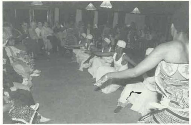
Danses africaines — dernière soirée.