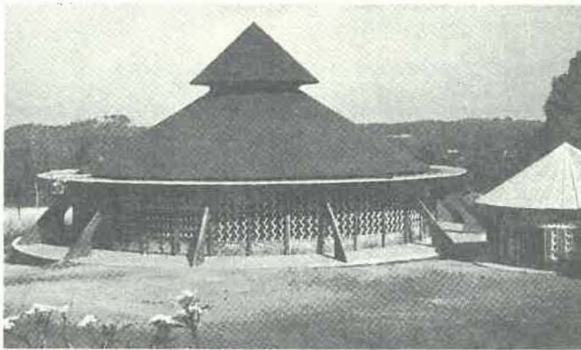
La nouvelle cathédrale de Bambari.