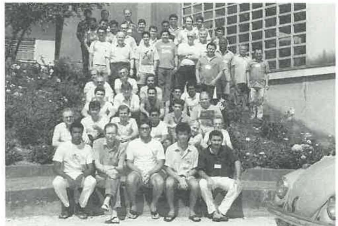
Les participants à l'assemblée du 29 janvier au 2 février.

Quatre jours auparavant, une cinquantaine de Spiritains s'étaient retrouvés au même endroit pour discuter ensemble du changement de statut du District du Brésil Sud. Il fut décidé que le premier chapitre de la Province se tiendrait à São Paulo, du 3 au 13 septembre 1990, autour de trois thèmes principaux: (1) l'Administration: élaboration et vote des sta-