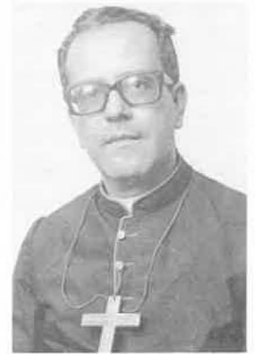
Dom Mário Clemente Neto, Bispo de Tefé, na Amazônia.

os Espiritanos Irlandeses, em 1963, formando o Distrito do Brasil Sudoeste e os Espiritanos Portugueses, em 1975, formando o Distrito Sudeste. O Grupo Irlandês assumiu a responsabilidade do Seminário menor em Emilianópolis, SP, no ano de 1967, que seria depois transferido para Adamantina, SP, e viria a fechar em 1972. O Seminário menor de Itaúna, MG, fecharia antes de 1970, enquanto o de Salete continuou até 1987. O Seminário menor de Cruzeiro do Sul (Alto Juruá), AC, continua funcionando.