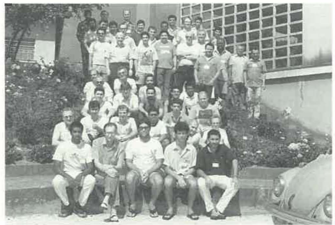
Os participantes da Assembleia, em Capão Redondo, de 29 de Janeiro a 02 de Fevereiro.

de Fevereiro, no mesmo local, para aprofundar o significado da transição do Distrito Sul para Província. Ficou decidido que a Província realizaria seu primeiro Capítulo de 03 a 13 de Setembro do ano em curso, em São Paulo. Para estudo no Capítulo, foram escolhidos três temas centrais: (01) Administração, com a criação e votação dos novos estatutos da Província. (02) Tipo de Formação a ser dada aos candidatos. (03) Missão ad intra (Nordeste? Amazônia? Alto Juruá?) e Missão ad extra (América Latina? África?). A Assembleia nomeou três comissões para estudar os temas supra-mencionados cujos textos deverão ser apresentados ao Conselho Provincial em Agosto. O Capítulo elegerá a Administração Provincial, a qual tomará posse no dia 02 de Fevereiro de 1991.