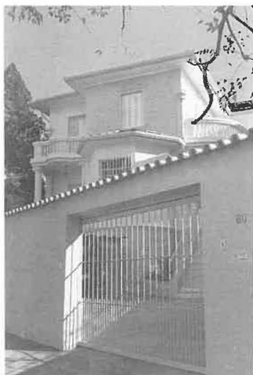
A Casa Provincial

Santíssimo Rosário e alguns leigos. A região é muito populosa e a equipa é responsável por 11 comunidades (bairros), 01 favela, alguns blocos residenciais de apartamentos populares e um conjunto Promorar.