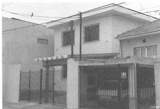
A Casa de Teologia no Jardim Planalto.

A Província está muito comprometida com as prioridades da Igreja da América Latina, centradas na Teologia da Libertação e Opção preferencial pelos Pobres. Desenvolve uma grande atividade no campo da pastoral religiosa e litúrgica e na conscientização para a Justiça e Paz, nas Comunidades de Base, onde se pode criar um maior contato inter-pessoal do que nos grandes grupos paroquiais. A formação de líderes é essencial e, dentro da Congregação, a preparação dos Irmãos é feita no aspeto pastoral e profissional, de modo a poderem trabalhar