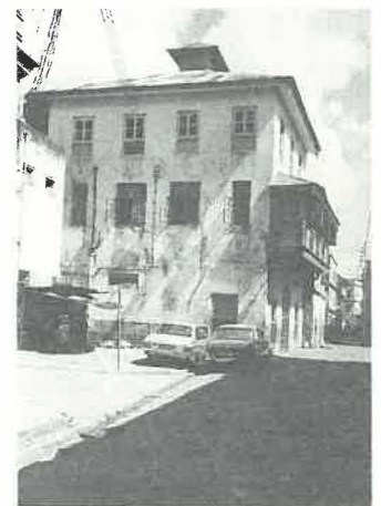
La première maison spiritaine de Mombasa, achetée en 1891.