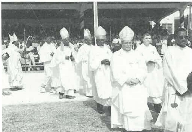
Entrée des évêques dans le stade de Mombasa pour la messe d'ouverture de la semaine du centenaire.

Des milliers de catholiques, venus de tout le Kenya, se sont rassemblés à Mombasa, durant la semaine du 5 au 12 août, à l'occasion des cérémonies de clôture de l'année de renouveau pastoral qui a marqué le centenaire de l'Église dans ce pays. Cette année commémorative avait débuté par une messe à Mombasa, le dimanche 13 août 1989. Plusieurs cérémonies officielles, à l'échelon paroissial et diocésain, avaient souligné l'importance de l'événement, ainsi que deux lettres pastorales communes des évêques: la seconde analysait avec courage les divers problèmes auxquels ce pays doit faire face. La date d'ouverture de cette année du centenaire avait été choisi en souvenir du premier baptême catholique au Kenya, à la fin du siècle dernier. En effet, le 14 août 1889, le P. Alexandre Le Roy baptisait, à Mombasa, une petite fille originaire de Goa.