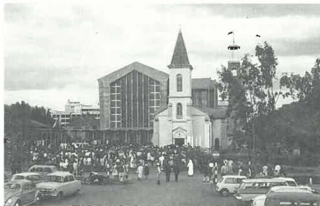
La cathédrale de la Sainte-Famille, Nairobi, le jour de sa consécration, en 1963. Au premier plan, l'ancienne église fut démolie par la suite. Un campanile élançé s'élève aujourd'hui à gauche de la cathédrale.

A cette époque, une mission encore plus importante fut créée à l'intérieur. En 1899, le chemin de fer de Mombasa allait jusqu'à ce qui est aujourd'hui la capitale du Kenya, Nairobi, mais qui, à l'époque, n'était qu'un petit campement pour les travailleurs employés à la construction de la voie ferrée. Cette année-là, Mgr Emile Allgeyer, successeur de Mgr de Courmont en 1897, et deux prêtres arrivèrent là et on leur donna un bout de terrain, à 2 km de la voie ferrée. Appelée pendant très longtemps la Mission Française, Saint-Augustin appartient maintenant à l'histoire parce que c'est là que les "Pères" plantèrent les premiers plants de café. Cette mission fut le berceau de la principale culture d'exportation du Kenya d'aujourd'hui. En 1903, on donna à Mgr Allgeyer un terrain de deux hectares sur lequel le Frère Josaphat construisit l'église de la Sainte-Famille, la première construction en pierre de Nairobi. Elle fut démolie en 1963, quand on construisit l'actuelle cathédrale de la Sainte-Famille. Au cours des années, et au fur et à mesure du développement de la ville, Nairobi fut doté de plusieurs nouvelles paroisses. La première mission dans la campagne Kikuyu, au nord de