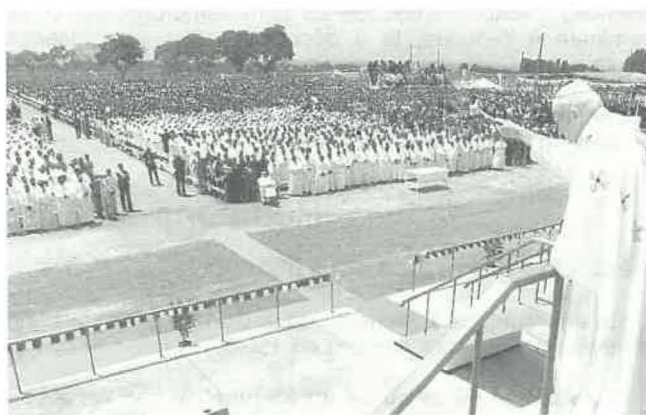
Le Pape Jean Paul II aux célébrations du centenaire

Aujourd'hui, le diocèse de Moshi, avec 5.000 km 2 de superficie, est le moins étendu des 29 diocèses tanzaniens, mais il y a 568.000 catholiques sur 840.000 habitants, soit près de 70% de la population. Les Chaggas, comme les Ibos au Nigeria, se sont ouverts à l'Evangile, et les vocations sa-