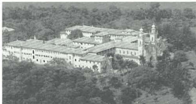
"Vila Kostka", a Casa dos Jesuítas em Itaiçi, perto de São Paulo, Brasil, local do Capítulo Geral de 1992.

Apresentamos a lista das Circunscrições por ordem alfabética e de acordo com o État du Personnel , com o respetivo número de delegados. As Províncias vão indicadas em letra maiúscula, os Distritos em caracteres romanos e os Grupos em itálico.