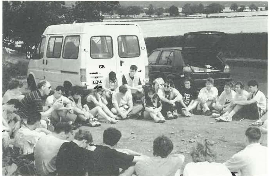
Marche-Pèlerinage en Europe

Bien conscients que les jeunes sont passés d'une "culture de soumission" à une "culture de l'expérience", nous essayons de leur faire faire une expérience de ce qu'est la foi-en-action en les engageant personnellement, au cours de l'année, dans toute une série d'événements et d'activités: marche de "100 miles", retraites, ateliers, rencontres à Taizé, pèlerinages à Lourdes, carrefours, week-ends de la jeunesse à la Pentecôte et réunions de groupes chaque quinzaine. Notre but est de construire leur foi, les aidant à devenir responsables eux-mêmes et les rendant capables d'un