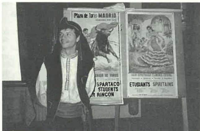
Jovem espiritano europeu e... espanhol

O encontro realizado em Chevilly, de 03 a 12 de Abril, reuniu 65 participantes vindos das diferentes Províncias da Europa ou em Formação na Europa. Viveram juntos as celebrações litúrgicas da Semana Santa e da Páscoa. Cada qual deu um testemunho sobre as iniciativas e a vida de sua Província; visitaram os lugares onde viveram Poullart des Places e Libermann (Notre Dame du Gard); todos tiveram a oportunidade de fazer uma experiência de imersão na capital: em Auteuil, com os presos, com os deficientes, com grupos de marginalizados, na Sorbonne, com a comunidade asiática e africana, etc. Estes compromissos foram depois refletidos em comum à luz do Mistério Pascal e das orientações da Congregação.