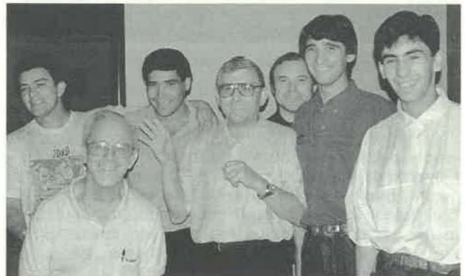
Estudantes espiritalanos com seus Formadores, no Paraguay

De 09 a 13 de Março, realizou-se em Asuncion do Paraguay o primeiro encontro dos Superiores da América Latina (Brasil, Paraguay, México, Haiti e Carafbas). Foi decidido abrir um Noviciado de língua espanhola em Porto Rico, em Julho de 1994, o qual será frequentado pelos Noviços do Haiti, de Porto Rico, do México, do Paraguay e da Espanha. As outras Circunscrições da Região colaborarão na medida de suas possibilidades. O aumento de vocações nesta região é portador de muitas esperanças.