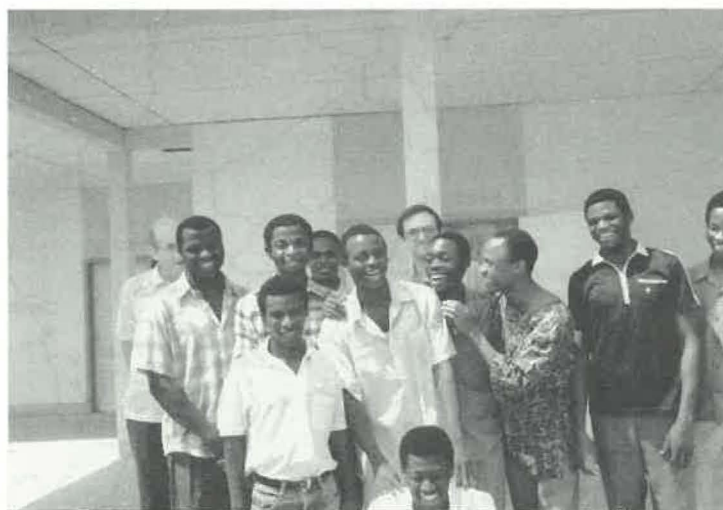
Jeunes de la WAF, prêts pour la Mission.