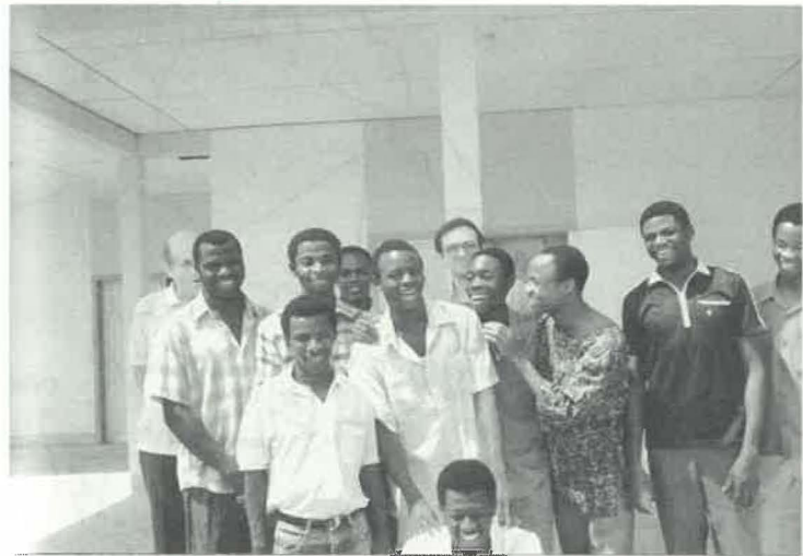
Jovens da WAF, prontos para a Missão.