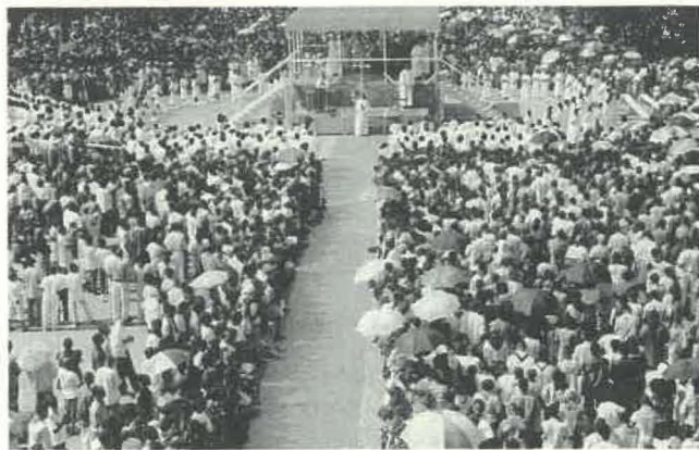
Célébration du Centenaire à Bangui

L'Eglise de Centrafrique compte maintenant plus de 500.000 baptisés et 50.000 catéchumènes répartis dans six diocèses. Deux Evêques sont centrafricains, dont Mgr Joachim N'DAYEN, l'actuel Archevêque de Bangui. Les évêques de Bambari, Mgr Michel Maître, et de Bangas-