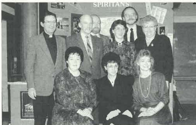
Groupe de Laïcs-Associés au Canada