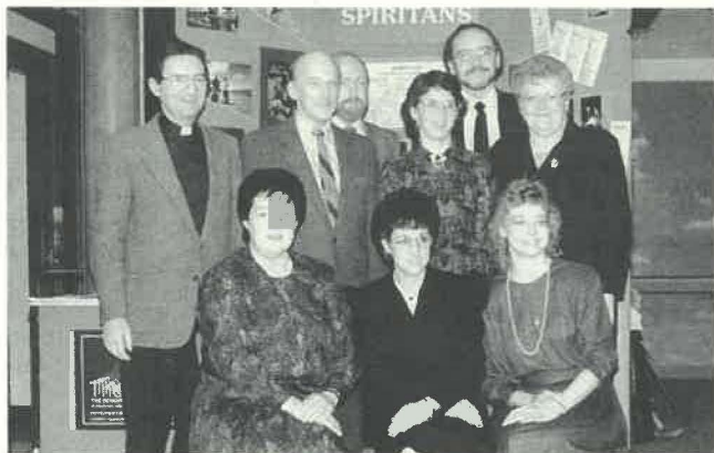
Grupo de Leigos Associados no Canadá.