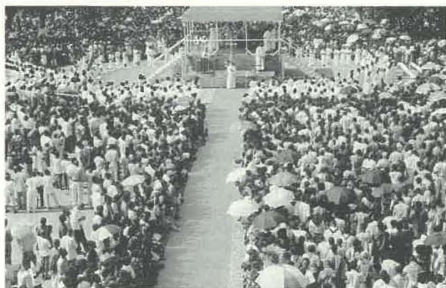
Celebração do Centenário em Bangui.