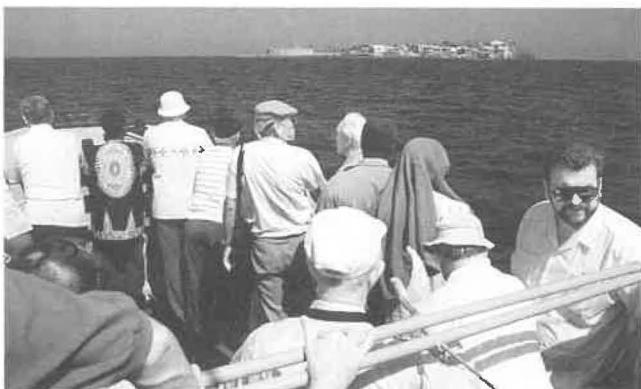
150 ans après: des missionnaires contempnent Gorée