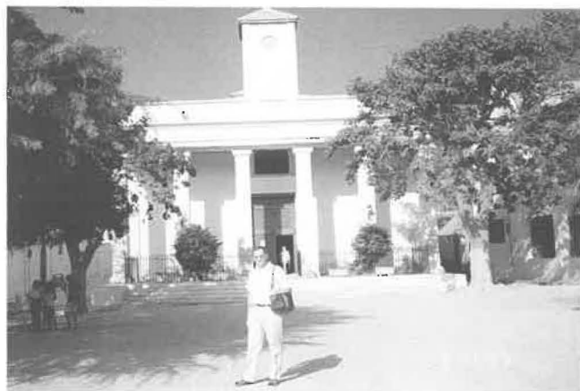
La basilique de Poponguine. Au 1er plan, le P. Fogarty

Promenade à Poponguine, Fadiouth et Ngasobil, le dimanche 21 mai.