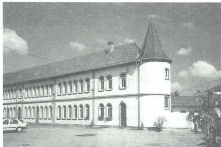
Centro Libermann, Saverne

O Centro começou a "irradiar". Membros da equipa foram convidados a pregar retiros e recollecções em lugares fora do Centro. Estes retiros não são limitados a comunidades de religiosos. Um membro da equipa faz uma palestra sobre o Espírito Santo todas as Sextas-feiras da Quaresma na paróquia de Saverne"