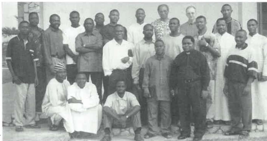
Deux Conseillers Généraux et quelques confrères de la WAF-Makurdi présents à la réunion d'Ejisu les 27 et 28 décembre 1999

Cette division assurera une présence spiritaine importante dans chacune des Régions, dès le départ. Chacune peut être considérée comme une zone de mission selon notre charisme spiritain, et une zone de vocations potentielles dans la Congrégation. Chaque Région devra donc faire face à son propre défi missionnaire, en collaboration avec toute la Province.