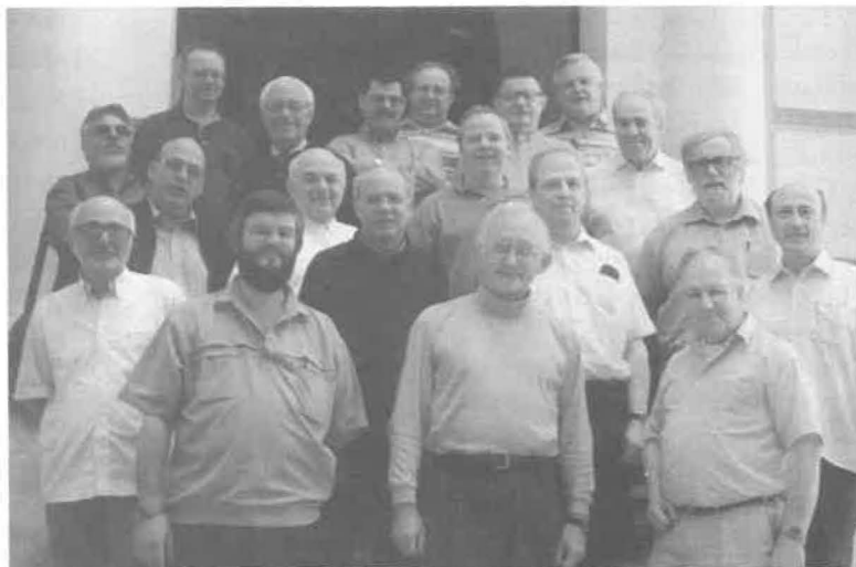
Les économistes et procureurs spiritains d'Europe

Les économistes et procureurs ont pris une journée pour visiter Subiaco, là où Saint Benoît, Patron de l'Europe, a vécu. Ils ont terminé cette journée par la visite des