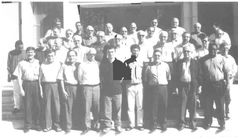
Délégués au Chapitre

Dans la Province du Portugal, il y a toujours eu une relation de travail très forte avec les laïcs, à travers les diverses organisations fondées par des Spiritains. Celles-ci visaient différents segments du Peuple de Dieu et embrassaient à la fois l'éveil et l'action missionnaires. Cependant, durant ce Chapitre, nous avons découvert que les choses sont en train de changer: les laïcs, tout en désirant aider concrètement, veulent aussi partager notre spiritualité, pour participer à la préparation et à l'actualisation de notre mission, et pour boire aux sources de notre inspiration. Diverses propositions ont été faites en tenant compte de cela: formation des laïcs, établissement de fraternités spiritaines, meilleur esprit d'accueil dans nos maisons, moments de prière commune, centre de spiritualité spiritaine, renouvellement de notre animation missionnaire et restructuration de nos publications missionnaires.