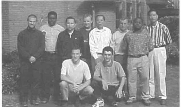
Trois continents, une famille