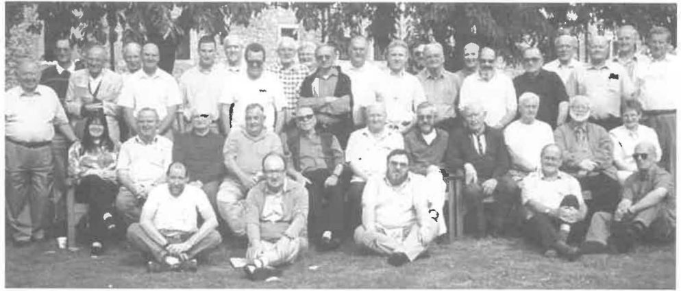
Participants au Conseil Provincial Elargi

- Chacun a senti que nous devrions continuer à jouer notre rôle dans la mission ad extra, qui fut une tradition si forte dans la Province pendant des années. Nous devrions aussi être prêts à servir nos frères dans le monde entier au niveau de la Congrégation, ce à quoi notre formation internationale nous a providentiellement préparé.