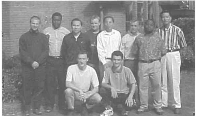
Três continentes, uma família