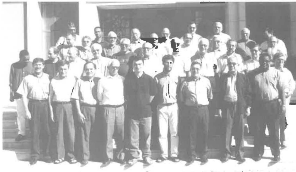
Delegados ao Capítulo

Na província portuguesa sempre houve um trabalho muito intenso com os leigos através de vários organismos fundados pelos espiritanos e dirigidos a camadas diferentes do povo de Deus: jovens, professores, adultos, no sentido da animação missionária do Povo de Deus e do voluntariado missionário. No entanto, neste capítulo houve a percepção de que estamos num momento diferente: os leigos, além de ajudar e colaborar, querem partilhar a nossa espiritualidade, participar mais na programação e na realização de nossa missão e beber de nossas fontes de inspiração. Assim várias propostas vão nesse sentido: formação dos leigos, constituição de fraternidades espiritanas, maior abertura de nossas casas, momentos de oração em conjunto, centro de espiritualidade espiritana, renovação de nossa animação missionária, reestruturação da administração de nossa editorial missionária.