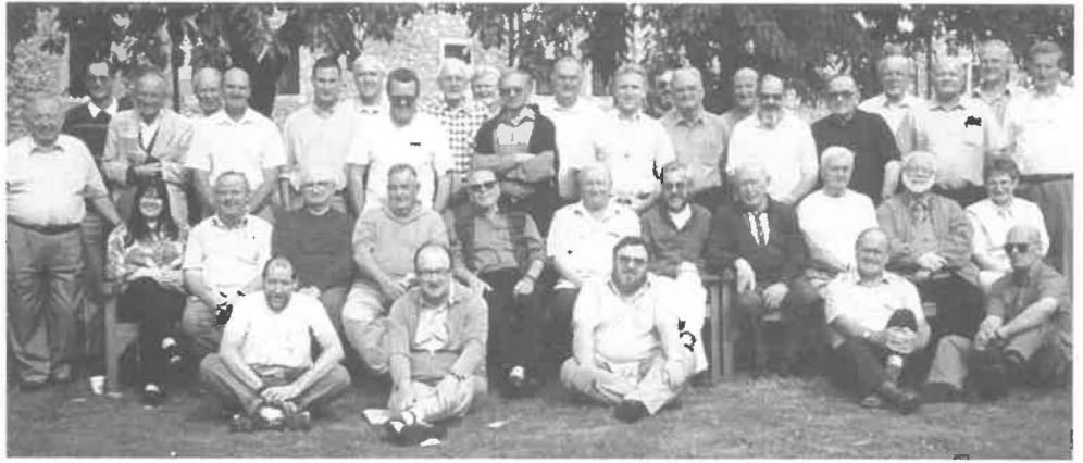
Participantes ao Conselho Alargado