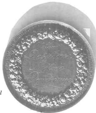
Médaille commémorative (revers)