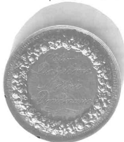
Medalha comemorativa (reverso)