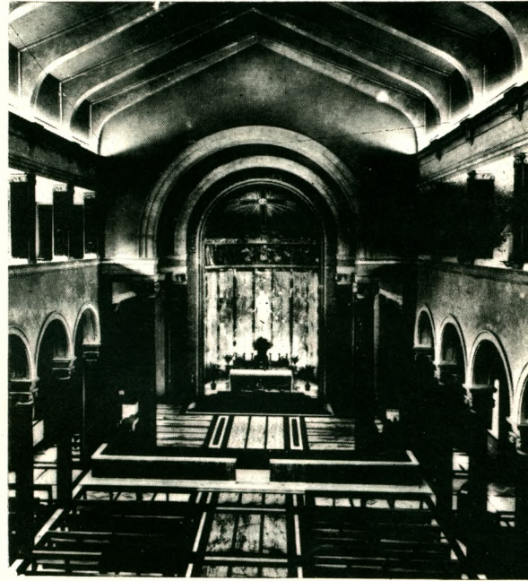
La chapelle principale, de 550 places. Des petits autels sont installés dans les deux ailes de la galerie.

La Domus est dirigée par des dames de l'Action Catholique italienne et le service est assuré par du personnel laïc.